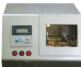
دستگاه Flash point