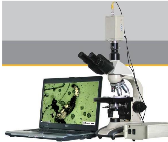
میکروسکوپ مجهز به دوربین و نرم افزار