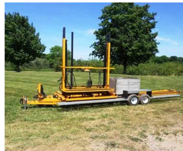
شکل ۵- سکوی بالابر برداشت نیمه مکانیزه نوع کششی به همراه جعبه انتقال (نمای جانبی)

در شکل ۶ ماشین کمکی (کاربرد انسان- ماشین) برای برداشت نیمه مکانیزه سیب نشان داده شده است. در این ماشین دو نفر پیاده میوه‌های قسمت‌های پایین درختان را چیده و با استفاده از کیسه‌های مخصوص روی نقاله دریافت‌کننده ماشین می‌ریزند. علاوه بر آن دو نفر نیز روی سکوهای ماشین قرار می‌گیرند و میوه‌های قسمت‌های بالایی درخت را به کمک ماشین برداشت می‌کنند. در این نوع از ماشین‌ها معمولاً در انتهای مسیر انتقال میوه به مخزن یک مسیر درجه‌بندی برای جدا کردن میوه‌ها نیز در نظر گرفته شده است.