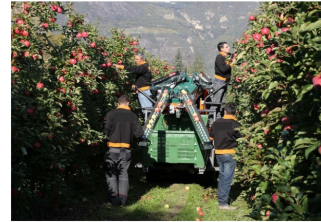
شکل ۱۰- ماشین نیمه مکانیزه خودگردان دارای نقاله مخصوص انتقال میوه به جعبه