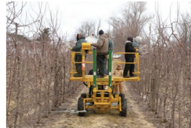
شکل ۱۱- بکارگیری ماشین برداشت نیمه مکانیزه خودگردان در عملیات هرس

ماشین های برداشت نیمه مکانیزه سیب را می توان به سیستم نورپردازی تجهیز نمود. اینکار سبب می شود تا امکان برداشت در شب فراهم آید. همچنین با بکارگیری و تعبیه کمربند خدمه ماشین به افزایش ایمنی خدمه و کاهش مخاطرات احتمالی می توان کمک نمود.