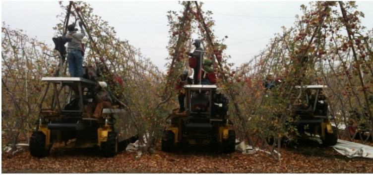
شکل ۷- به کارگیری همزمان چند ماشین برداشت نیمه مکانیزه خودگردان در عملیات برداشت سیب