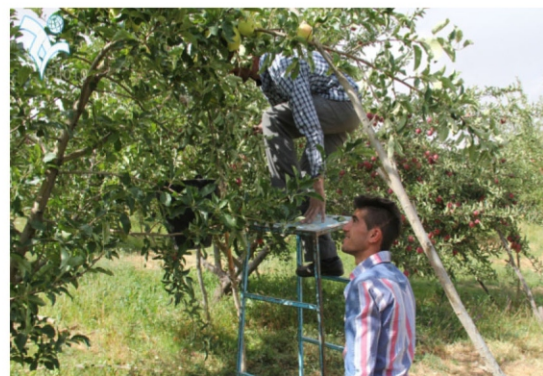
شکل ۳- نمونه‌هایی از دسترسی سخت و مخاطره‌آمیز در برداشت دستی سیب‌های بالای درخت