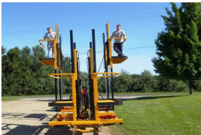
شکل ۴- سکوی بالابر برداشت نیمه مکانیزه نوع کششی (نمای روبرو)

در برداشت نیمه مکانیزه، برداشت میوه‌ها توسط انسان ولی به کمک تجهیزات کمکی و ماشین صورت می‌گیرد. در این روش ماشین فرد یا افراد میوه‌چین را در مکان‌های مورد نظر در اطراف درخت قرار می‌دهد. این تجهیزات با عناوین مستقرکننده انسانی، سکوی میوه‌چینی سیار، نردبان هیدرولیکی، مستقرکننده چندکارگری، سکوی استقرار و بالابر و کمک برداشت معروف هستند. اینها قابلیت حرکت در باغ و جایگیری در محل مناسب برای برداشت را دارند. در این روش حداقل یک نفر بر روی سکویی که جعبه‌ای نیز روی آن قرار داده شده، می‌تواند بایستد. سکو به صورت کشویی می‌تواند در داخل ریل حرکت نماید و بالا و پایین آمدن ریل توسط جک‌های هیدرولیکی و یا مکانیکی انجام می‌پذیرد. بعد از پرشدن جعبه روی سکو، کارگر جعبه را با پایین آوردن سکو در ریل، آن را در جعبه انتقال خالی می‌نماید. جعبه‌های انتقال برای انتقال موقت میوه از باغ به محل شرکت‌های بسته‌بندی و قبل از عرضه به بازار استفاده می‌شوند و ابعادی بزرگ‌تر از جعبه‌های متداول و بسته‌بندی شده دارند. در شکل ۴ محل استقرار نفرات روی سکوی بالابر (نمای روبرو) و در شکل ۵ نمای جانبی نحوه قرارگیری جعبه انتقال نشان داده شده است. این نوع ماشین‌ها توسط تراکتور و به صورت کششی به حرکت در می‌آید.