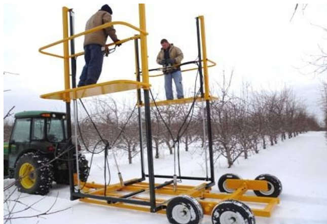
شکل ۹- سکوی بالابر ساده نوع کششی تراکتوری مخصوص باغات

۸- سیستم ارتفاع‌گیری افراد در جایگاه برداشت به صورت پلکانی و هر پله به عرض نیم متر تا یک و نیم متر (به دلیل تعریض) در نظر گرفته شده است.