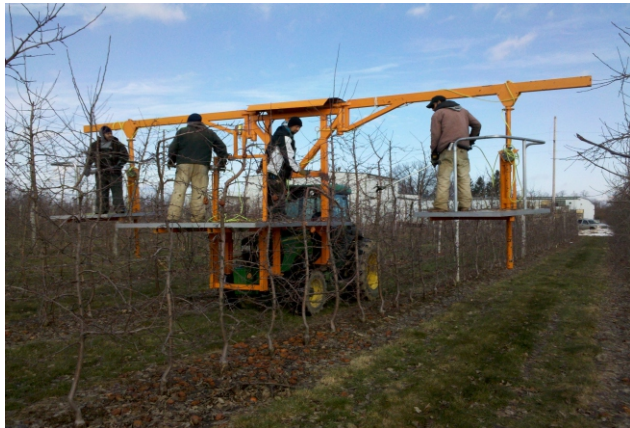
شکل ۸- به کارگیری سکوی معلق برداشت سوارشونده تراکتوری در عملیات هرس درختان با ردیف های متراکم