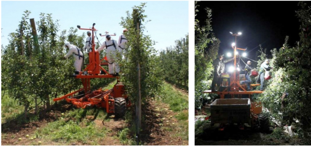
شکل ۱۲- ماشین نیمه مکانیزه برداشت دارای کمربند ایمنی خدمه ماشین و نورپردازی برای کار در شب