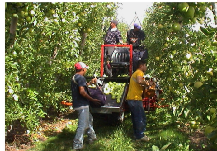
شکل ۶- نمایی از عملیات نیمه مکانیزه برداشت سیب (دو نفر پایین پیاده و دو نفر در بالای سکوی برداشت)

در شکل ۶ ماشین کمکی (کاربرد انسان- ماشین) برای برداشت نیمه مکانیزه سیب نشان داده شده است. در این ماشین دو نفر پیاده میوه‌های قسمت‌های پایین درختان را چیده و با استفاده از کیسه‌های مخصوص روی نقاله دریافت‌کننده ماشین می‌ریزند. علاوه بر آن دو نفر نیز روی سکوهای ماشین قرار می‌گیرند و میوه‌های قسمت‌های بالایی درخت را به کمک ماشین برداشت می‌کنند. در این نوع از ماشین‌ها معمولاً در انتهای مسیر انتقال میوه به مخزن یک مسیر درجه‌بندی برای جدا کردن میوه‌ها نیز در نظر گرفته شده است.