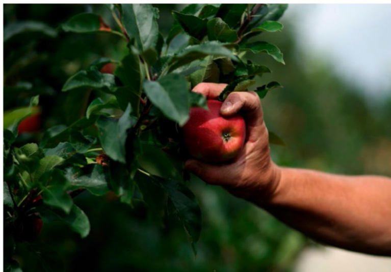
شکل ۲- نحوه صحیح برداشت دستی سیب برای جلوگیری از صدمات مکانیکی

چیدن دستی به عملیاتی گفته می شود که در آن میوه از ساقه نگهدارنده خود (بند میوه) توسط کارگر ماهر جدا می شود. برداشت کننده با گرفتن میوه در میان دست و پیچیدن آن و سپس با کشش سریع آن تحت زاویه ای، عمل چیدن را به انجام می رساند. البته برای مصرف تازه خوری باید اکثریت میوه ها با احتیاط و با حداقل فشار به میوه چیده شوند (شکل ۲)