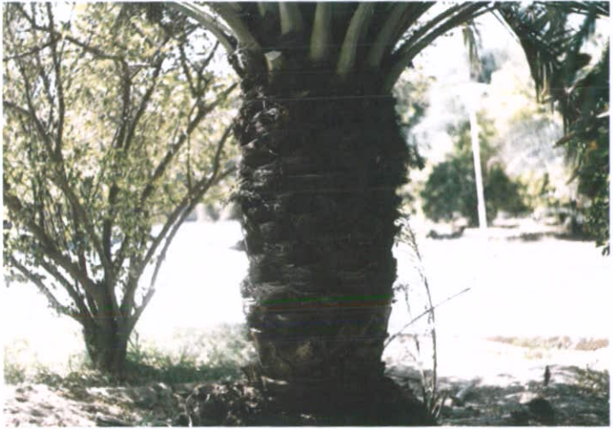
شکل ۱: هرس برگ و ته برگ خرما

گردیده است طراحی و ساخت پایه و دسته و کلاً سیستم برش دستگاه با تیغه گرد بر مناسب که قابلیت هرس برگ و ته برگ تا عمق ۸/۵ سانتی متر را داشته باشد، به انجام رسید.