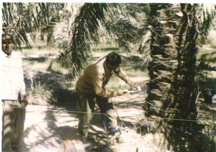
شکل ۳: هرس ته برگ با استفاده از تیغه گرد بُر

می‌توان برای هرس برگ و ته برگ (به طور کلی برای عملیات بهزراعی) و همچنین عملیات داشت و برداشت میوه از آن استفاده کرد. همچنین در کلکسیون‌های جدید الاحداث نخل‌های جوان خرما که ارتفاع اکثر نخل‌ها حدود ۲ تا ۱/۵ متر می‌باشند می‌توان از این دستگاه به طور عمده استفاده کرد.