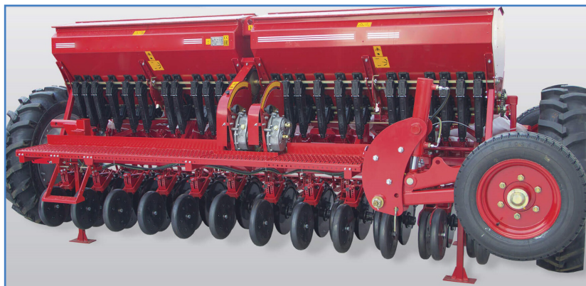
شکل ۲- خطی کار چرخ‌گرد