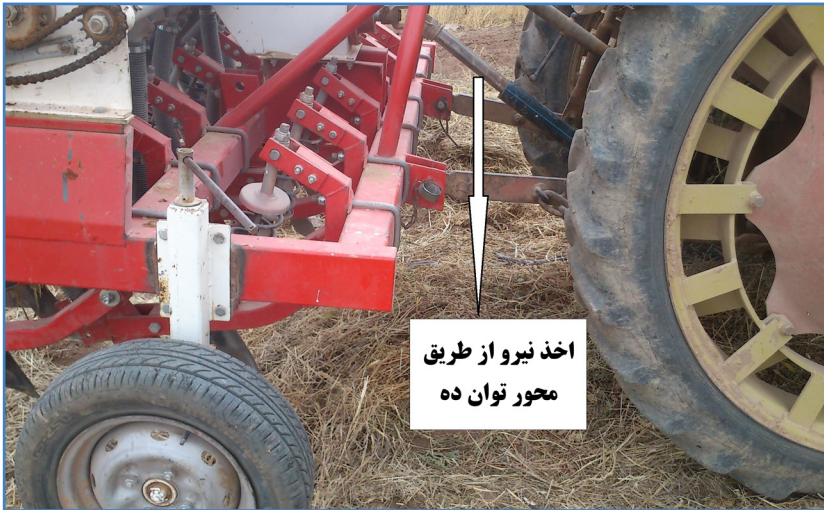
شکل ۳- خطی کار محور گرد: قابلیت کشت در شرایط آبی و دیم