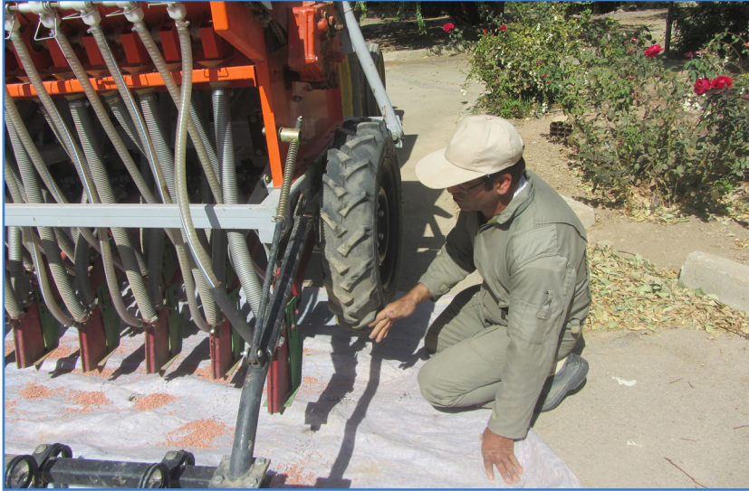
شکل ۹- چرخش چرخ به تعداد ۲۰ دور

در صورتی که چرخ محرک را ۲۰ دور بچرخانیم، با استفاده از رابطه ۱، می‌توان مقدار بذر ریخته شده داخل سینی یا پارچه برزنتی را محاسبه کرد.