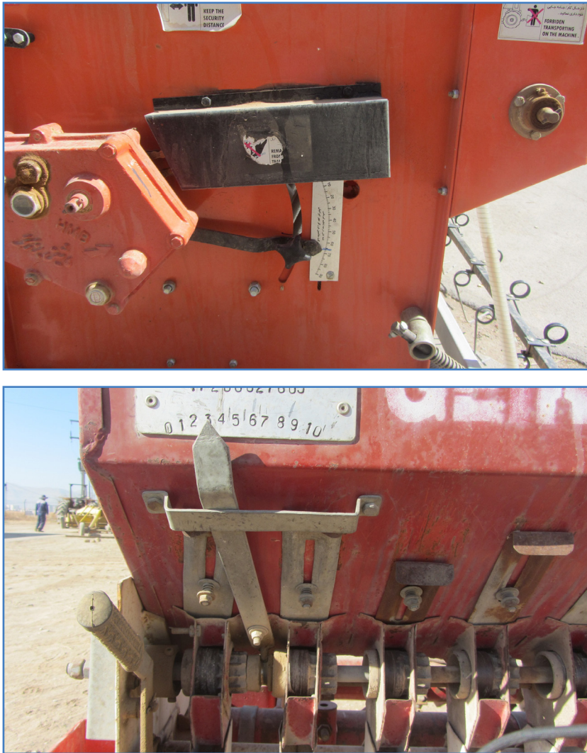
شکل ۴- اهرم تنظیم بذر در دو نوع بذرکار

معمولاً راهنمای اهرم تنظیم با توجه به مقدار بذر در هر هکتار، توسط جداولی از طرف سازنده ارائه شده است. همچنین میزان بازبودن زبانه خروجی موزع می بایست تنظیم شود (شکل ۵). برای بذور دانه ریز، دهانه دریچه خروجی موزع می بایست بر روی کم ترین مقدار باشد. برای گندم و جو میزان بازشدگی