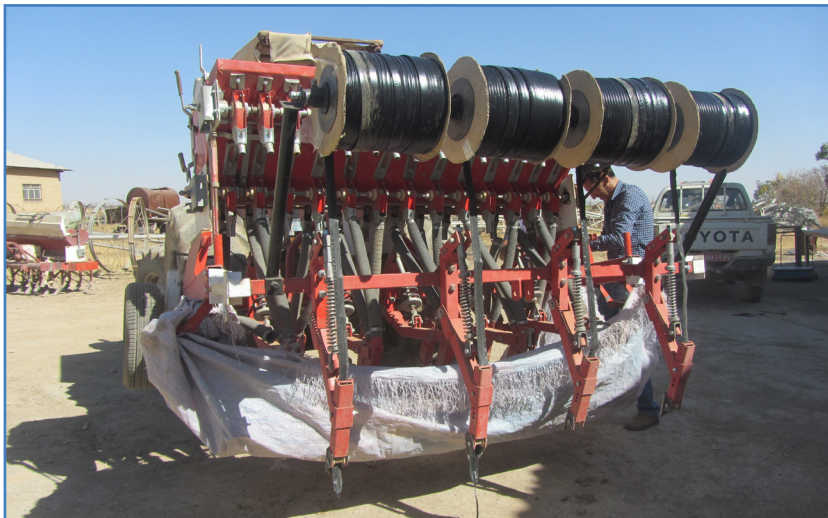
شکل ۱۰- استفاده پارچه کتان یا پلاستیک به منظور کالیبراسیون بذرکار محورگرد

سینی بذر را بر روی دستگاه نصب می‌کنیم. در صورت نبود سینی بذر، یک پارچه برزنتی یا پلاستیکی را که کمی بزرگ‌تر از عرض کار بذرکار باشد، انتخاب می‌کنیم (شکل ۱۰).