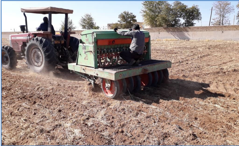
شکل ۱۱- خطی کار مخصوص دیم (نیروی لازم برای چرخش موزع از طریق چرخ فشار تأمین می‌شود)

نیروی از طریق زنجیر و جعبه دنده به محور موزع انتقال می‌یابد. واسنجی این نوع دستگاه‌ها به روش مزرعه‌ای، مشابه واسنجی کارنده آبی است و به دیم‌کاران پیشنهاد می‌شود از این روش استفاده کنند. مثال زیر روش واسنجی دیم‌کار به روش مزرعه‌ای را بیان می‌کند.