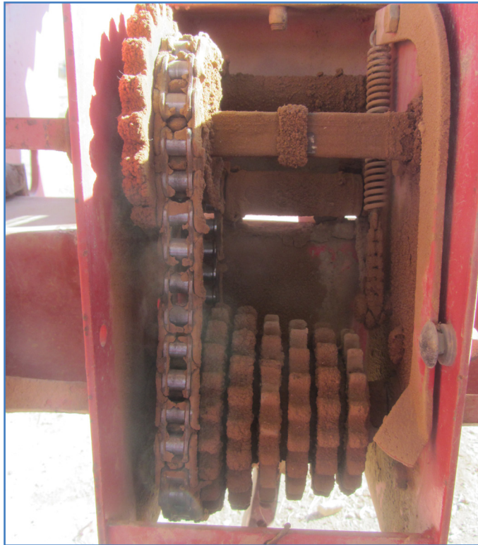
شکل ۱۳- با جابه‌جا کردن چرخ دنده‌ها می‌توان تراکم دلخواه را به دست آورد.

در صورتی که این تعداد بذر حاصل نشود، با تغییر چرخ دنده می‌توان تراکم مدنظر را به دست آورد (شکل ۱۳).