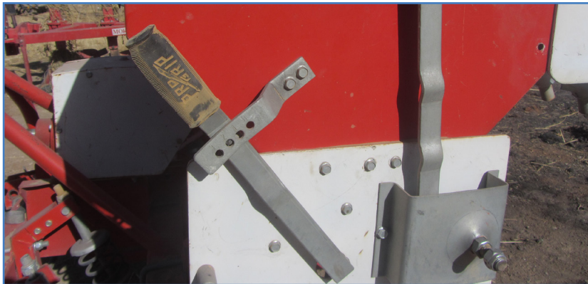
شکل ۵- اهرم تنظیم میزان بازبودن دریچه خروجی موزع در دو نوع بذرکار

ابتدا محیط چرخ را اندازه‌گیری می‌کنیم. این کار را می‌توان با استفاده از نوارهای فلزی یا پلاستیکی انجام داد (شکل ۶).