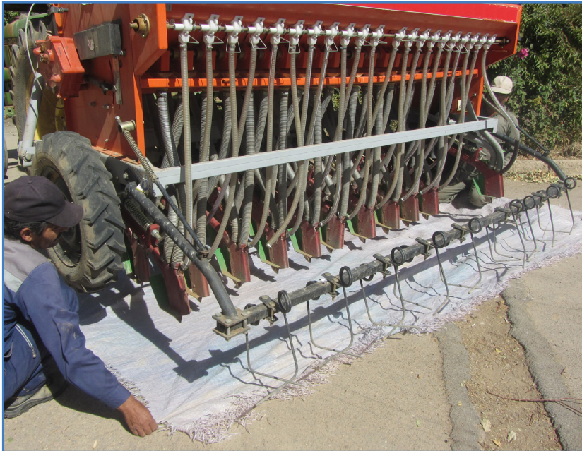
شکل ۸- استفاده از پارچه برزنتی یا پلاستیکی در صورت نبود سینی مخصوص واسنجی

بعد از آن سینی مخصوص واسنجی را در قسمت زیر موزع‌ها قرار می‌دهیم. اگر سینی مخصوص در اختیار نباشد، می‌توان از یک پارچه برزنتی یا یک نایلون ضخیم استفاده کرد (شکل ۸).