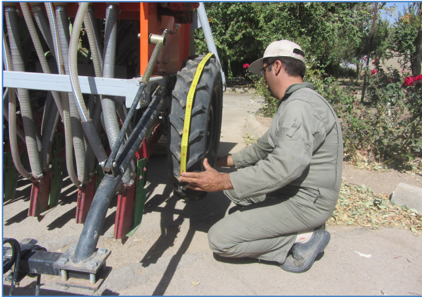
شکل ۶- اندازه‌گیری محیط یا درو چرخ بذرکار

عرض ماشین را اندازه‌گیری می‌کنیم. برای اندازه‌گیری عرض ماشین کافی است تعداد واحدهای کارنده را در فاصله بین دو کارنده ضرب کنیم (شکل ۷). روش دیگر این است که با استفاده از یک متر فلزی، فاصله شیاربازکن اولی و انتهایی را اندازه گرفت و مقدار به‌دست آمده را با فاصله بین دو شیاربازکن جمع کرد.