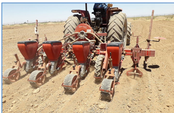
شکل ۱۲- ردیف‌کار برای کشت ذرت، لوبیا و...

روش واسنجی ردیف‌کارهای پنوماتیک و مکانیکی مشابه است. نوع پنوماتیکی آن در بین کشاورزان بیش تر رایج است (شکل ۱۲). در کشت ردیفی، تراکم را معمولاً برحسب تعداد بوته در هر هکتار بیان می‌کنند. مثلاً برای ذرت ۹۰,۰۰۰ تا ۱۱۰,۰۰۰ بوته در هکتار توصیه می‌شود. گاهی نیز بر اساس فاصله بذر طولی بیان می‌شود. در کشت ردیفی بین دو پشته معمولاً ۶۰ تا ۷۵ سانتی متر است. روش کشت معمولاً به صورت ۲ ردیف بر روی پشته یا یک ردیف بر روی پشته است، که روش کالیبراسیون برای هر نوع الگوی کشت توضیح داده می‌شود. نکته اینکه در اینجا روش کارگاهی توضیح داده شده است.