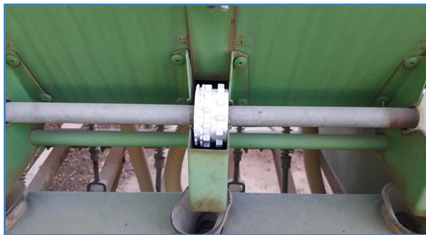
شکل ۱- موزع مخصوص غلات (بالا) و موزع مخصوص ریزدانه (پایین)