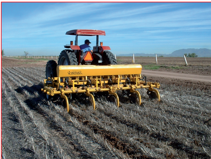
شکل ۷- شکل دادن مجدد به شیارها یا فاروهای آبیاری در سامانه بسترهای بلند بدون تخریب بسترها

سامانه کشت روی بسترهای بلند اولین بار توسط کشاورزان مکزیکی در دهه ۱۹۷۰ میلادی برای کشت گندم و بر روی بسترهای باریک با روش آبیاری شیاری در دره یاکی واقع در شمال غربی کشور مکزیک استفاده شد. مهم‌ترین تفاوت این روش با کشت جوی و پشته‌ای اینست که در جوی و پشته بعد از پخش بذر بر روی زمین که توسط بذرپاش صورت می‌گیرد، با استفاده از فاروئر مبادرت به ایجاد جوی و پشته می‌شود و بعد از اتمام فصل کشت جوی و پشته برای آماده‌سازی کشت بعدی تخریب می‌شود. اما در سامانه بستر بلند، بسترها همزمان با کشت ایجاد شده و بسترها به صورت دائمی نگهداری می‌شوند و فقط شیارها در صورت نیاز مجدداً بازسازی و فرم داده می‌شوند (شکل ۷).