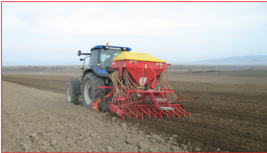
شکل ۳- استفاده از کمبینات برای کشت گندم توأم با دستکاری شدید خاک