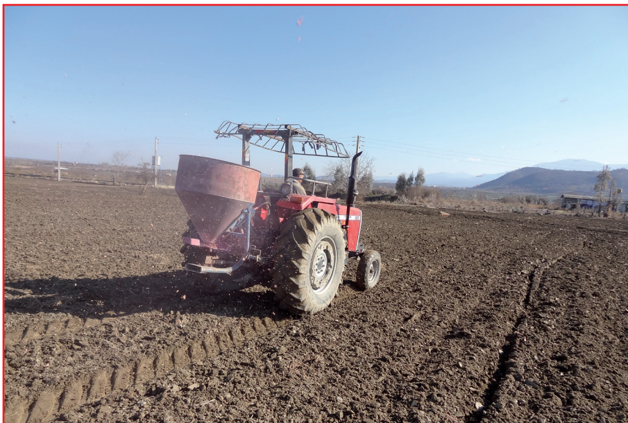
شکل ۱- استفاده از بذرپاش سانتریفیوژ برای کاشت گندم