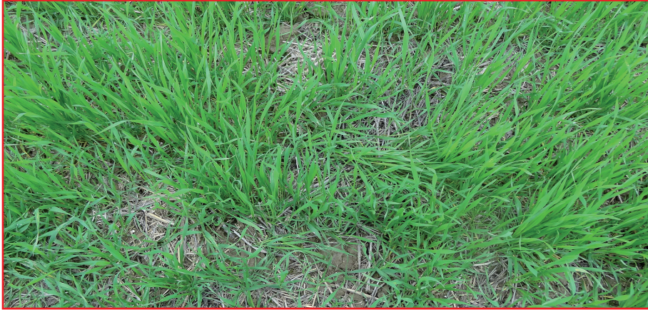
شکل ۴- استفاده از کارنده بی خاک‌ورز بر روی بقایای سویای فصل قبل