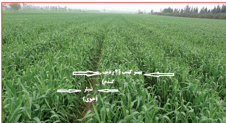
شکل ۶- استفاده از کودکار بذرکار روی بسترهای بلند کشت