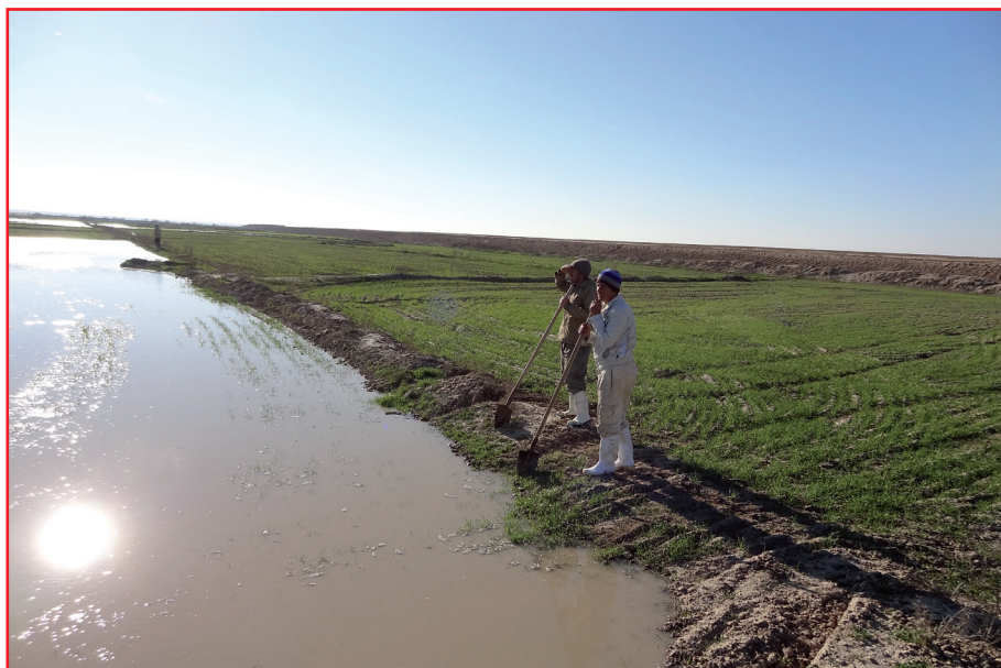
شکل ۲- هدررفت آب آبیاری در روش کشت پخش بذر

- کارایی تولید در اینگونه روش کاشت، به دلایلی مانند مصرف بالای بذر و نیز یکنواخت نبودن در سبز مزرعه (کمی بوته‌های گیاه در برخی نقاط و تراکم نسبی بوته‌ها در نقاط دیگر) بسیار پایین است.