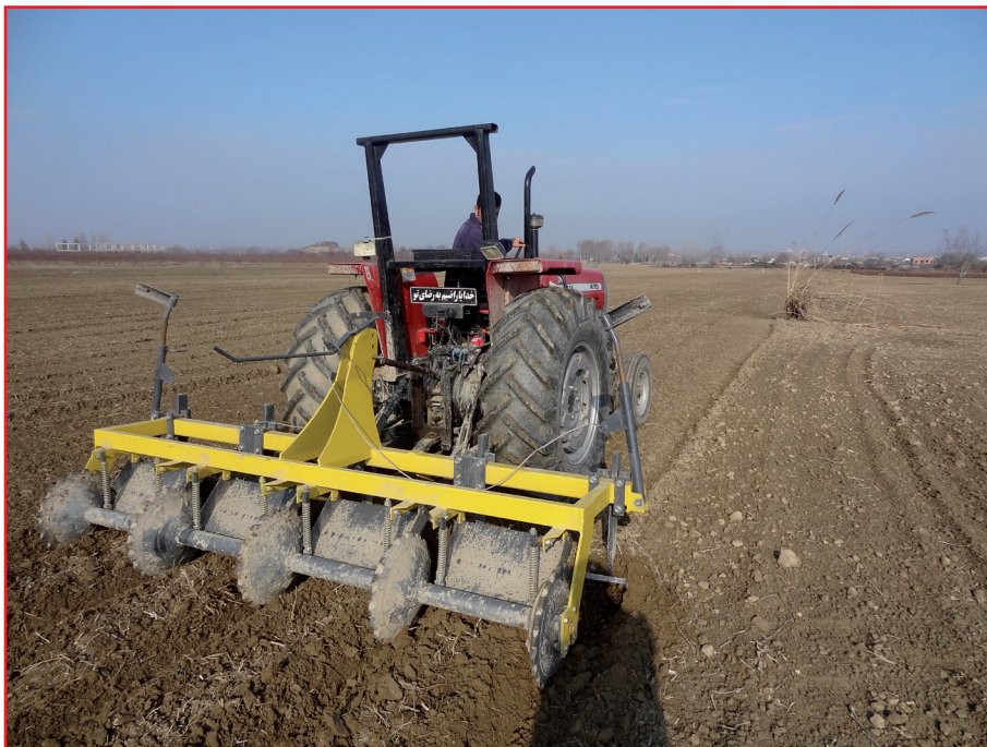
شکل ۸- فاروئر غلطکی که برای ایجاد بستر و شیار در بار اول در مزرعه از آن استفاده می شود.